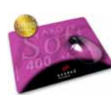
MousePad AXOSoft 400