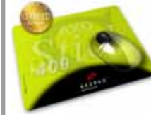
MousePad AXOStick 400