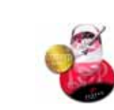
Untersetzer / Coaster AXOTop 850