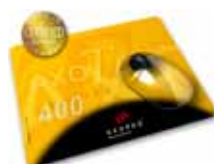
MousePad AXOTex 400