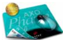
MousePad AXOPharm 400