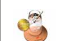
Untersetzer / Coaster AXONature 850