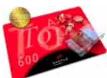
Zahlmatte / pay mat AXOTop 600