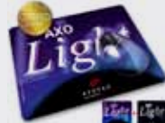
AXOLight Leuchteffekt bei Dunkelheit