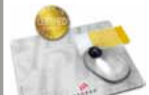
Mousepad AXOPlus 440