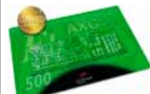
Schreibunterlage / desk pad AXOFlex 500