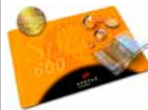
Zahlmatte / pay mat AXOSpeed 600