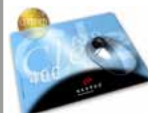
MousePad AXOClear 400