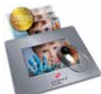
MousePad AXOPhoto 400