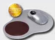
AXOSpecial Spezialpads mit zusätzlichen Ausstattungsmerkmalen

Auf der Basis der zertifizierten AXOPAD® - Systemkomponenten sind zusätzliche Sonderlösungen sowie attraktive Designvarianten erhältlich.