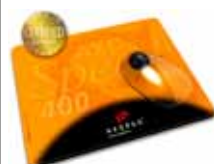
MousePad AXOSpeed 400