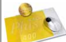
MousePad AXOPlus 400