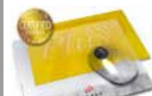
MousePad AXOPlus 430