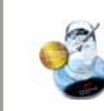
Untersetzer / Coaster AXOTop 850