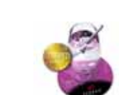
Untersetzer / Coaster AXOSoft 850