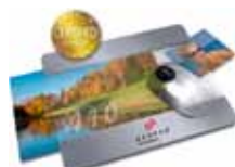
Mousepad AXOPhoto 410