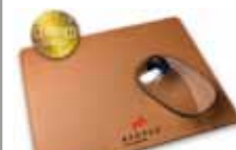
MousePad AXONature 400