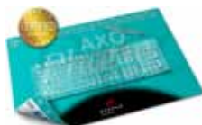
Schreibunterlage / desk pad AXOPharm 500