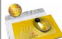
MousePad AXOPlus 420