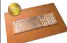
Schreibunterlage / desk pad AXONature 500