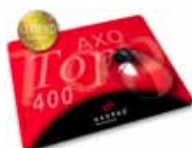
MousePad AXOTop 400