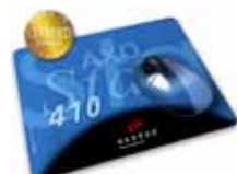
MousePad AXOStar 410