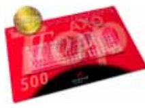
Schreibunterlage / desk pad AXOTop 500