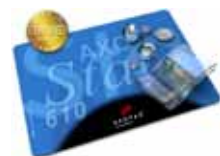
Zahlmatte / pay mat AXOStar 610