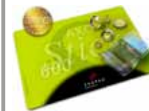
Zahlmatte / pay mat AXOStick 600