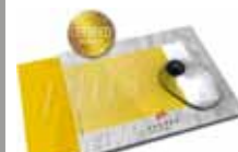
MousePad AXOPlus 410