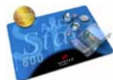
Zahlmatte / pay mat AXOStar 600