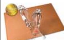
Fussauflage / foot rest AXONature 700