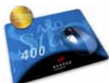
MousePad AXOStar 400