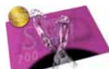
Fussauflage / foot rest AXOSoft 700