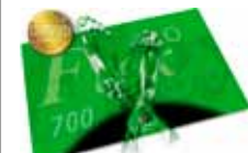
Fussauflage / foot rest AXOFlex 700