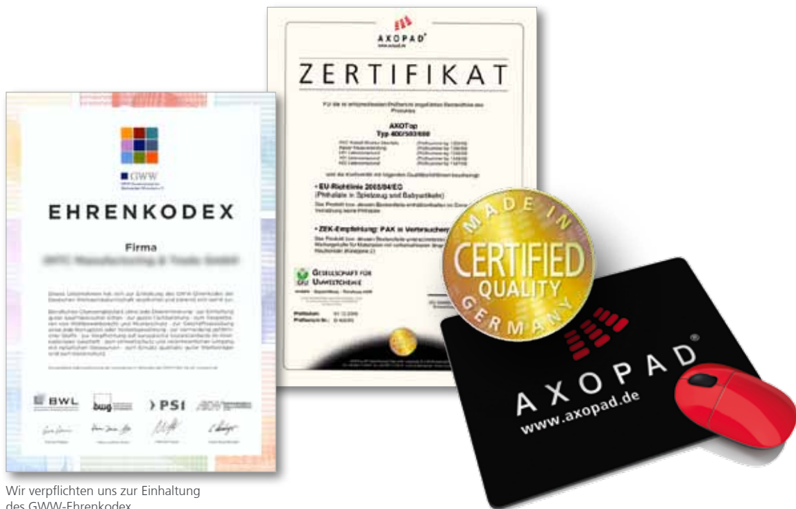
Wir verpflichten uns zur Einhaltung des GWW-Ehrenkodex.

Beschränkung der Verwendung bestimmter gefährlicher Stoffe