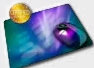
AXOEdition Ausgewählte Motivversionen und Designvarianten