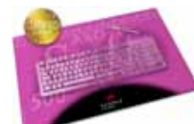
Schreibunterlage / desk pad AXOSoft 500