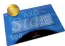
Schreibunterlage / desk pad AXOStar 500